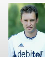
Fussballschule.de Harald Schumacher