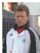
Ex-Schalke 04 Ingo Anderbrügge