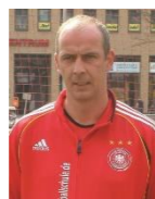
Ex- FC Bayern München Mario Basler