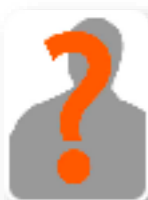
Nationalspielerin Ariane Hingst