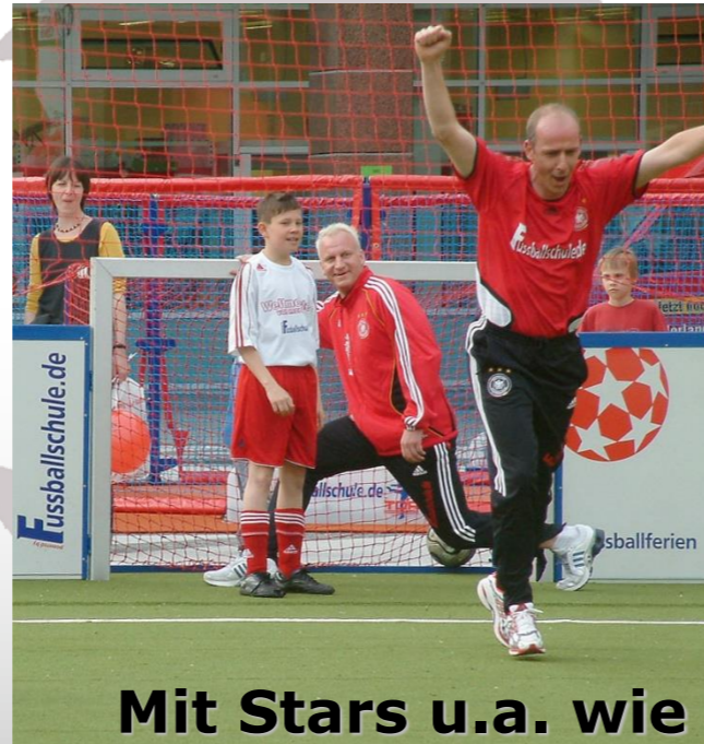
Mit Stars u.a. wie Mario Basler, Birgit Prinz ...