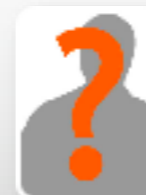
Profi Spieler VFB Stuttgart Sven Ulreich