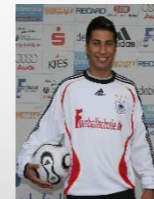
Vertrieb/Marketing Emek Altum