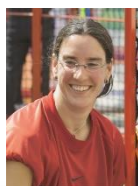
Weltfussballerin Birgit Prinz